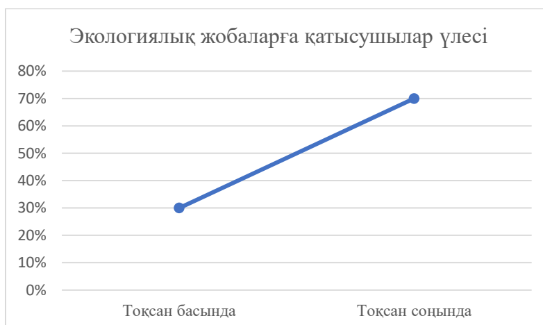
3-сурет – Көркем шығармаларды жаңа әдіспен талдағанға дейінгі және кейінгі экологиялық жобаларға қатысушылар үлесі

Зерттеу барысында тест және сауалнама алынған соң, осы уақытқа дейін өзге пәндер аясында болса да экологиялық жобаларға қатысқан оқушылардың үлесі 30%-ды құрады. Ал экономика тақырыбындағы бірнеше көркем туындыларды оқып, талдап, оның басты құндылығын анықтаған соң, оқушылар өздері әр туындыдан ғаламдық идеяларды шығарып, нәтижесінде экологиялық жобаларға қатысушы оқушылар саны 70%-ға дейін артты (3-сурет). Олар әр сенбі сайын мектеп аумағын қоқыстан тазалау, ағаш отырғызу, қараусыз қалған жан-жануарларға көмектесу секілді экологиялық акцияларда белсенділік таныта бастады.