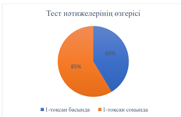
1-сурет – Көркем шығармаларды жаңа әдіспен талдағанға дейінгі және кейінгі тест нәтижелері

Тестілеуге қатысқан 30 оқушының тест нәтижелері бойынша орташа балы 60%-ды құрады. 1 тоқсан, яғни 2,5 ай көлемінде көркем шығармаларды оқып, талдап, түрлі әдіс-тәсілдерді қолдану нәтижесінде тоқсан соңында бұл көрсеткіш 85%-ға өсті 1-сурет.